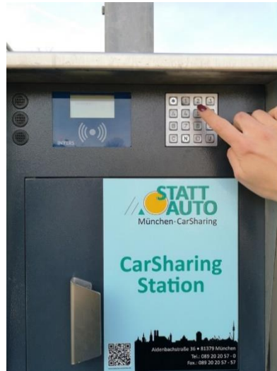
Abbildung 2 (Tastenfeld)