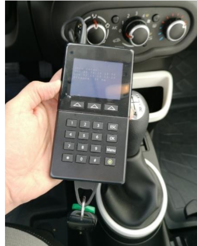
Abbildung 2 (Bedienterminal)

Bei Fahrzeugen mit Bordcomputer (BC) finden Sie den Fahrzeugschlüssel im Fahrzeug.