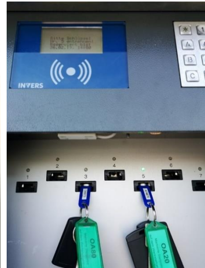
Abbildung 3 (Display / Bedienterminal)

Viele unserer Stationen verfügen über einen Tresor (Keymanager) für die Fahrzeugschlüssel.