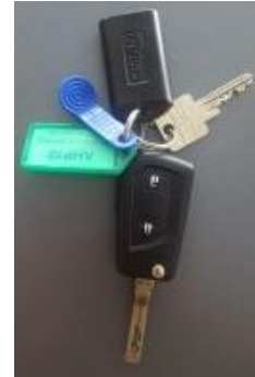
Abbildung 1 (Fahrzeugschlüssel mit Transponder)

Probleme mit der Wegfahrsperre. Es kommt leider immer wieder vor, dass Nutzer die Transponder (Abb. 1) von unseren Schlüsselanhängern abbauen. Dies hat zur Folge, dass das Fahrzeug nicht mehr anspringt.