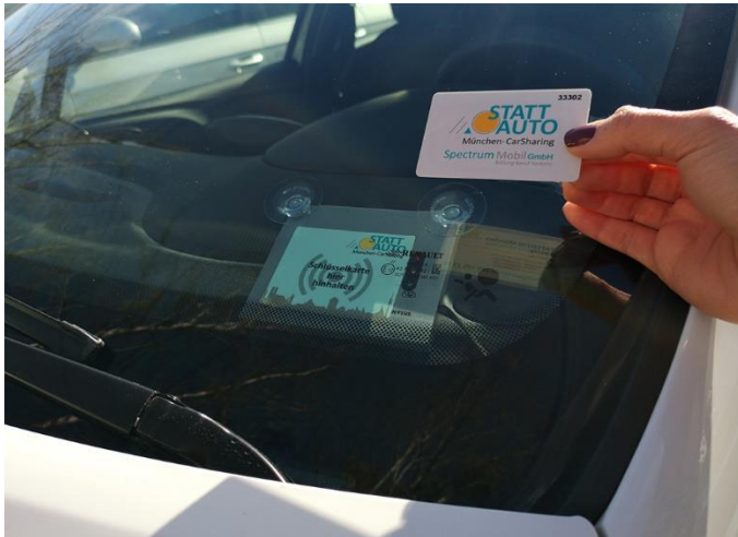
Abbildung 1 (Kartenleser)