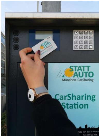
Abbildung 1 (Kartenleser)