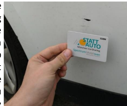
Abbildung 2 (Kratzer und Kundenkarte)

Als Nächstes untersuchen Sie bitte das Fahrzeug auf sichtbare Schäden (Dellen, Kratzer etc.). Wenn Sie Schäden am Fahrzeug feststellen, die mindestens so groß sind wie Ihre Kundenkarte (Abb. 2), gleichen Sie bitte den Schaden mit den Eintragungen in der Schadensliste in der STATTAUTO München App ab (Hinweise dazu siehe Bordbuch). Sind die Schäden noch nicht vermerkt, sind Sie zu Ihrer Absicherung verpflichtet, unsere Buchungszentrale vor Fahrtbeginn über den Schaden zu informieren. Bitte melden Sie ebenso außergewöhnliche Verschmutzungen des Fahrzeuges.